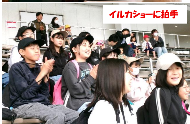
イルカショーに拍手