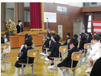
緊張しながらがんばりました

入学式にはとてもしっかりとした態度で参加することができました。また、話しかけられたことに「はい。」と返事をするので立派でした。