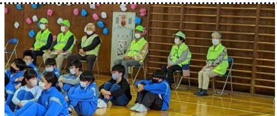
1年生を迎える会をご覧いただいたスクールガードの皆様