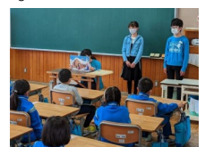
6年生の読み聞かせ

慣れない1年生が掃除をするのは難しいので、6年生が1年生教室の掃除を手伝っています。