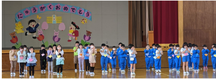
1年生のかわいいダンス

各学年からの工夫された発表、2年生から1年生へのプレゼント、さらには、1年生がお礼としてかわいいダンスを披露するなど、楽しく、心温まる素敵な会になりました。(今回は、情報交換会に来校いただいたスクールガードの方々にも子どもたちの様子を見ていただきました。)